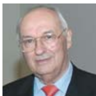
Ives Gandra da Silva Martins

Advogado. Doutor em Direito/USP. Professor de Direito Comercial/USP e EDESP – GVLaw. Professor dos Cursos de Especialização em Direito dos Contratos e Direito Empresarial do CEU - Departamento de Direito IICS.