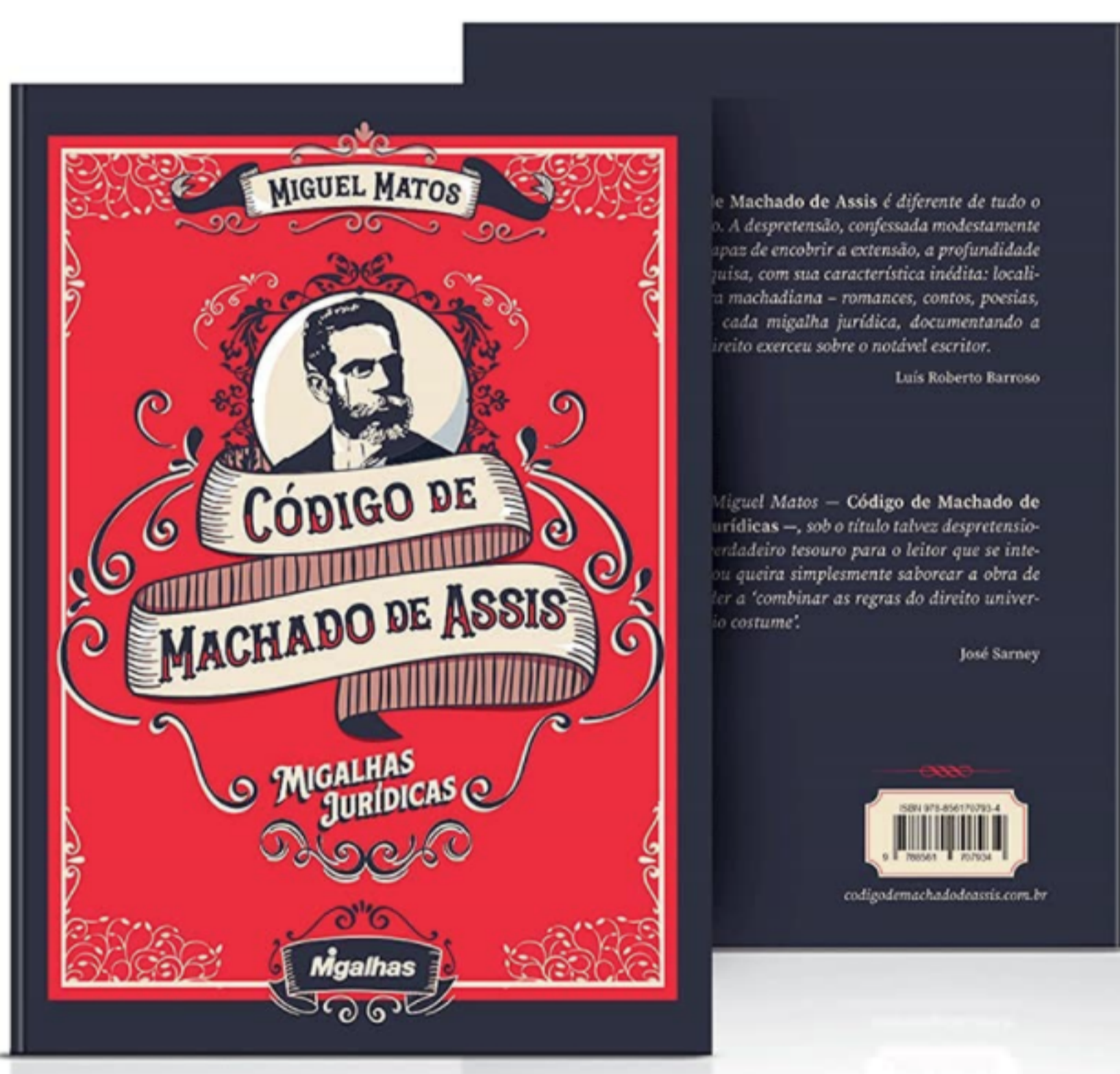
Código De Machado De Assis, de Miguel Matos (2021)

Grande apreciador da Literatura nacional, principalmente, das obras de Machado De Assis , Miguel Matos escreveu o primeiro trabalho sobre o Bruxo de Cosme Velho, em 2008.