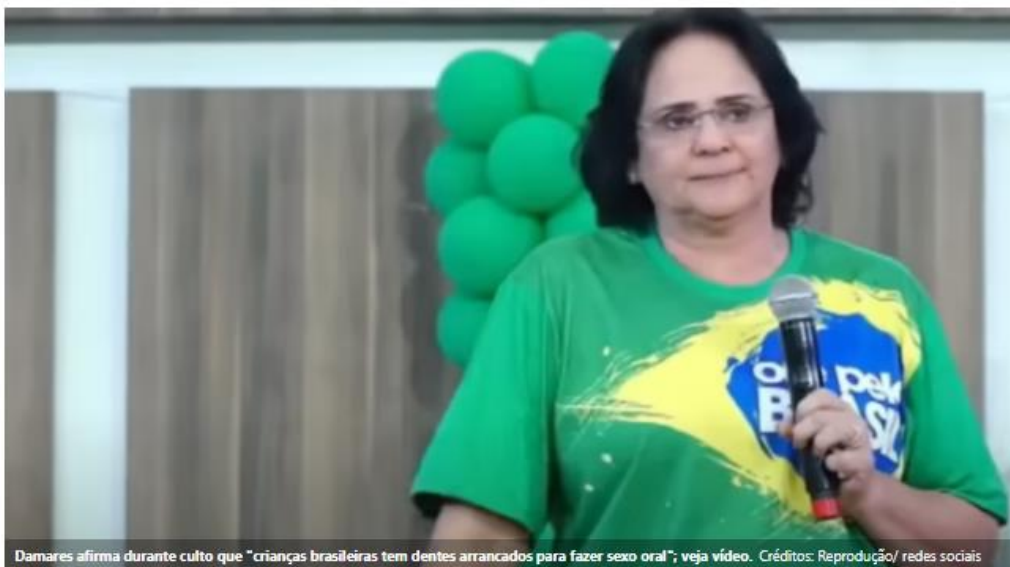
Damares afirma durante culto que "crianças brasileiras tem dentes arrancados para fazer sexo oral"; veja vídeo.

As declarações escabrosas da ex-Ministra da Família também falam sobre o uso de bebês para o comércio de vídeos pornográficos