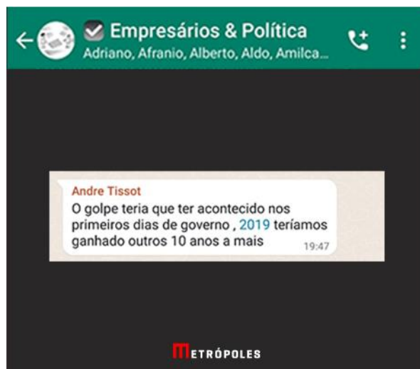
Mensagem de WhatsApp constante na reportagem