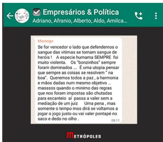
Mensagem de WhatsApp constante na reportagem

Como forma de tentar influenciar os votos de seus funcionários, o empresário JOSÉ KOURY teria dito: “Alguém aqui no grupo deu uma ótima ideia, mas temos que ver se não é proibido. Dar um bônus em dinheiro ou um prêmio legal pra todos os funcionários das nossas empresas” . Posteriormente, o mesmo empresário teria afirmado que iria encomendar “milhares de bandeirinhas para distribuir para os lojistas e clientes do Barra World Shopping a partir de setembro” .