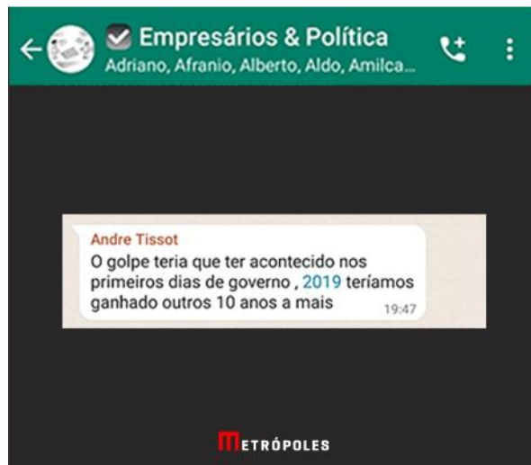
Mensagem de WhatsApp constante na reportagem