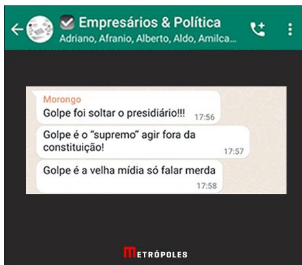
Mensagens de WhatsApp constante na reportagem