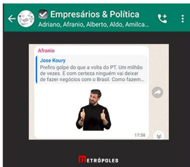
Mensagem de WhatsApp constante na reportagem