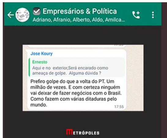
Mensagem de WhatsApp constante na reportagem