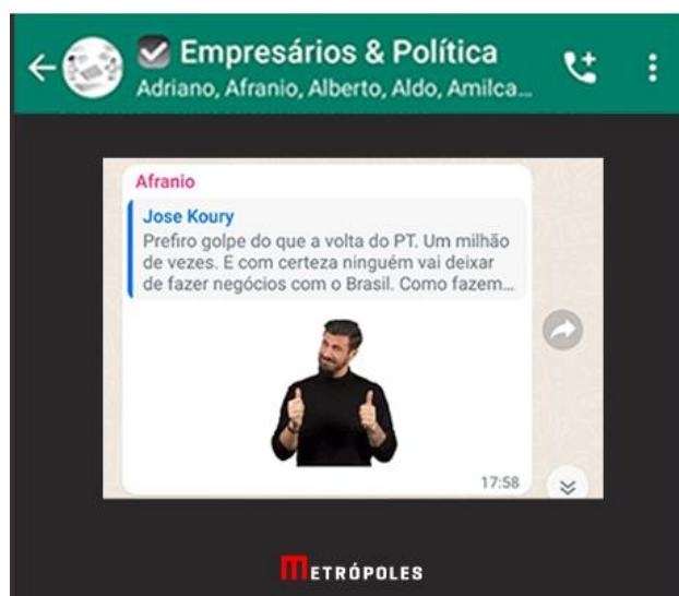
Mensagem de WhatsApp constante na reportagem