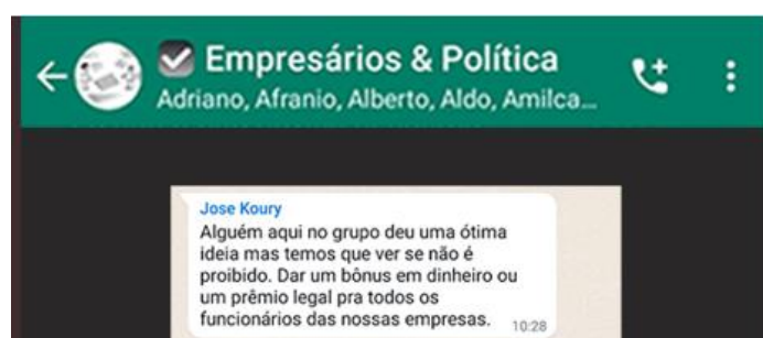
Mensagem de WhatsApp constante na reportagem