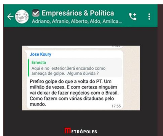
Mensagem de WhatsApp constante na reportagem