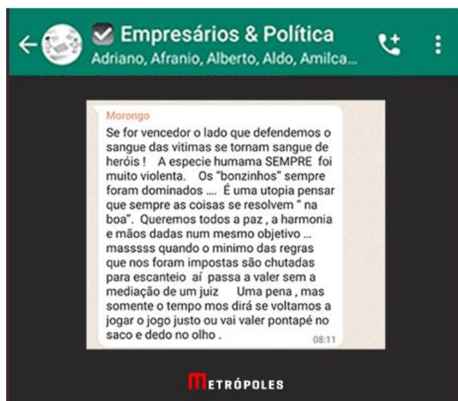
Mensagem de WhatsApp constante na reportagem

[sic] quando o mínimo das regras que nos foram impostas são chutadas para escanteio, aí passa a valer sem a mediação de um juiz. Uma pena, mas somente o tempo nos dirá se voltamos a jogar o jogo justo ou [se] vai valer pontapé no saco e dedo no olho