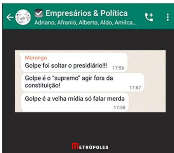
Mensagens de WhatsApp constante na reportagem