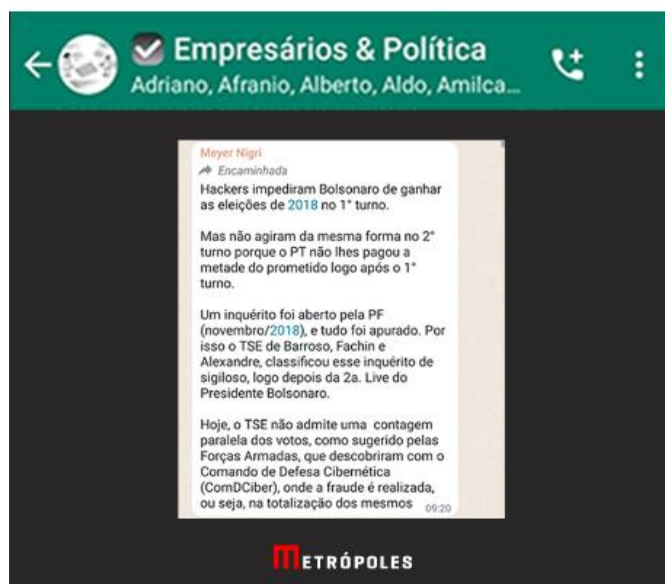
Mensagem de WhatsApp constante na reportagem

O mesmo sítio eletrônico postou uma nova matéria sobre o referido grupo de WhatsApp relatando a postagem de matérias com conteúdo falso. Em 17 de maio o empresário LUCIANO HANG teria postado uma mensagem listando uma série de efeitos colaterais “falsamente atribuídos ao imunizante pfizer”.