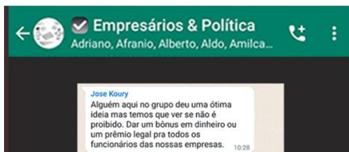
Mensagem de WhatsApp constante na reportagem

Como forma de tentar influenciar os votos de seus funcionários, o empresário JOSÉ KOURY teria dito: “Alguém aqui no grupo deu uma ótima ideia, mas temos que ver se não é proibido. Dar um bônus em dinheiro ou um prêmio legal pra todos os funcionários das nossas empresas”. Posteriormente, o mesmo empresário teria afirmado que iria encomendar “milhares de bandeirinhas para distribuir para os lojistas e clientes do Barra World Shopping a partir de setembro”.