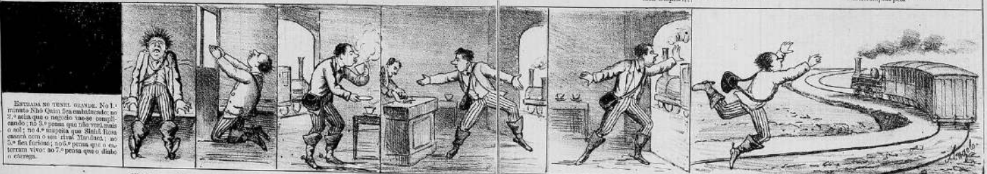
ENTRADA NO TUNEL GRANDE. No 1. minuto Nhô Quim fica embalsacado; no 2.º scia que o moço do tacho é compri- candio; no 3.º pensa que não verá mais o sol; no 4.º supoz que Sinhá Rosa casara com o seu rival Miraluz; no 5.º ficou furioso; no 6.º pensa que o es- trem virou no 7.º pensa que o diabo o estava.