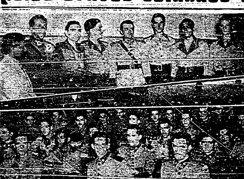
REFORÇO EM MASSA PARA AS RESERVAS DO EXERCITO. Reintegraram-se, hoje, os cursos do C. P. O. R. com a frequência de mil trezentos e vinte alunos. Na gravura, flagrantes da solenidade de reabertura. (Texto na 3.ª página.)

WASHINGTON, 2 (H. T.) — É o seguinte comunicado do Departamento de Guerra, baseado em informações recebidas até às 17 horas (GMT): "As forças do general MacArthur, na península de Bataan, continuaram a manter as suas posições avançadas, obtidas em seu recente ataque. O inimigo não fez qualquer esforço para contra-atacar." Na região a nordeste da ilha de Luzon, um pequeno destacamento de tropas norte-americanas e filipinas, operando nas montanhas, forçou o inimigo a abandonar o vale de Abao de Cervantes a Bangueid. Nada há a mencionar em relação às outras zonas."